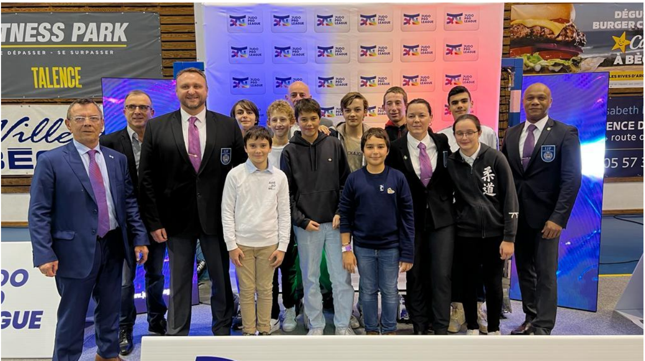
Notre école d'arbitrage avec le top du niveau de l'arbitrage Mondial

Le comité, par la commission d'arbitrage, avait invité les jeunes officiels de l'école d'arbitrage, un moment d'échange avec ce trio Mondial d'arbitres et de superbes photos.