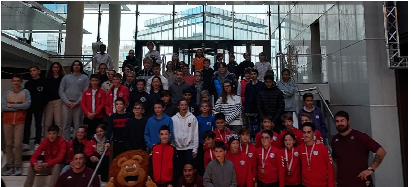
L'ensemble des jeunes champions et arbitres toutes disciplines confondues