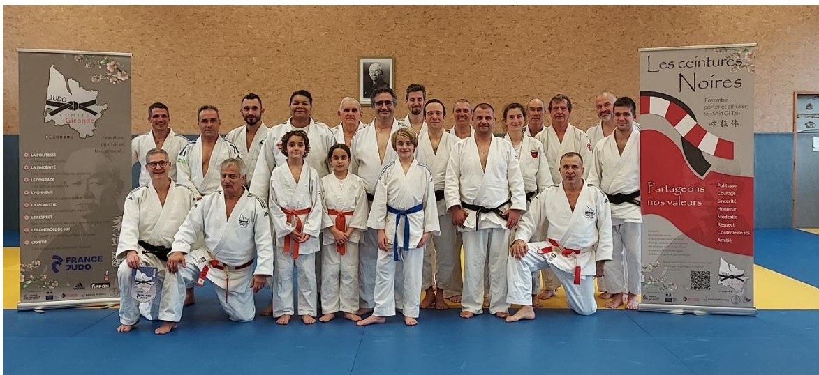
Le groupe self défense de l'après-midi à Créon