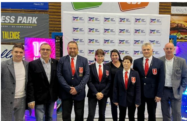
Les membres du comité