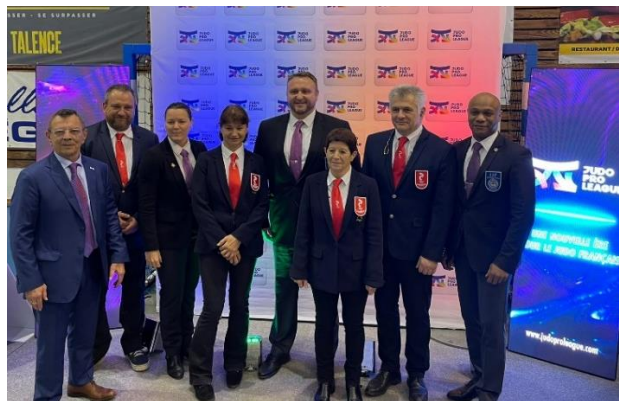
Les officiels de cette belle soirée